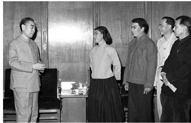
▲一九六六年十二月二十日，周恩來在觀看廣東粵劇院演出的《山鄉風雲》後接見了主要演員。左二為紅線女。