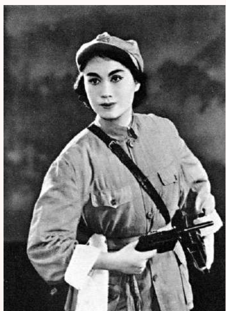
▲《山鄉風雲》的游擊隊長劉琴，是紅線女探索現代粵劇的一次重要嘗試。

「紅線女的一生，與祖國的命運、人民的抉擇緊密聯繫在一起，紅線女的一生自願奉獻給黨和國家。」紅線女藝術中心主任蒙菁告訴記者，紅線女藝術中心將始終以傳承和發展粵劇紅派藝術和紅線女精神為己任，為廣州乃至全國文化事業的繁榮與發展做出成績。