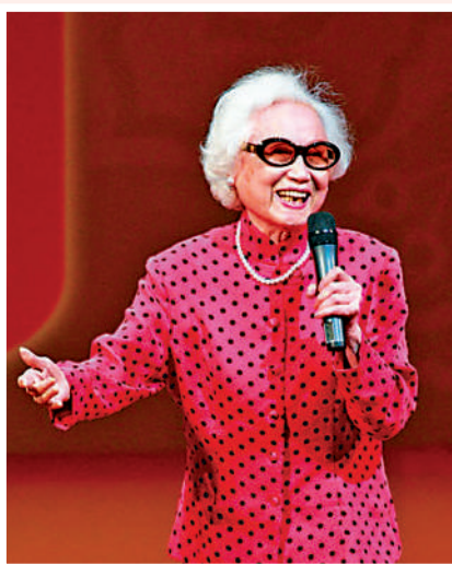
▲由初回內地於《搜書院》中飾演丫鬢翠蓮一角（右），到晚年依然登台表演（上），紅線女演活了「人民的藝術家」的一生。