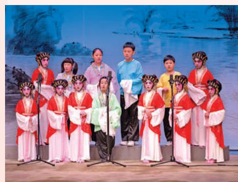
▲晚年的紅線女致力向年輕一代傳揚粵劇藝術。圖為香港小學生們表演粵劇大合唱。

進入新世紀後，看到粵劇市場的青少年觀眾逐漸流失，紅線女又提出應做好傳統藝術的傳承工作。她親任藝術總監，耗費四年時間完成製作了粵劇動畫《刁蠻公主憨驕馬》，以卡通的形式向年輕人推廣粵劇。該劇