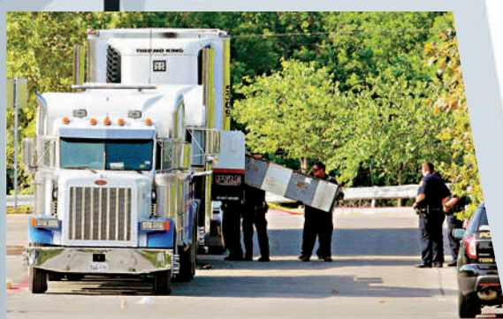
►2017年七月，美國得州警方在一輛貨車內，發現三十名偷渡客。