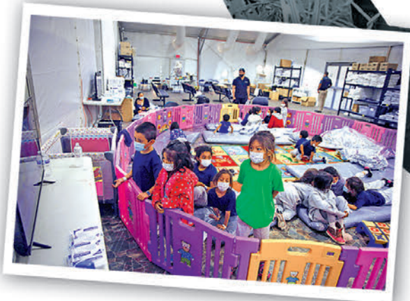
►大批難民被關在美國得州埃爾帕索市的拘留中心。