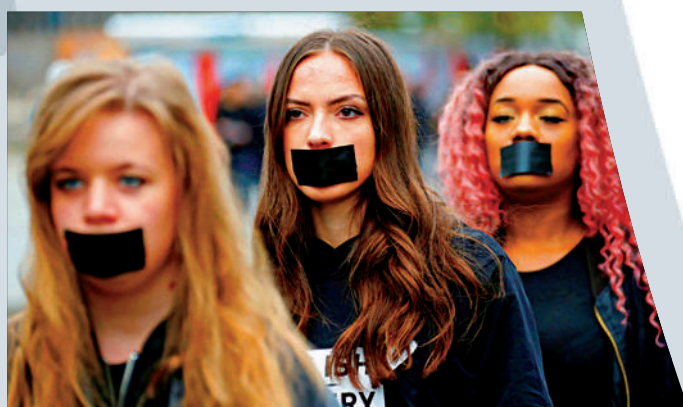
►2018年十月，女性示威者在柏林抗議拐賣人口。