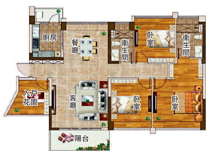
▲振業天頌花園143平米主力戶型的戶型圖。