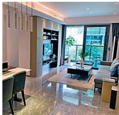
▲保利碧桂園·公園大道的樣板間客廳。