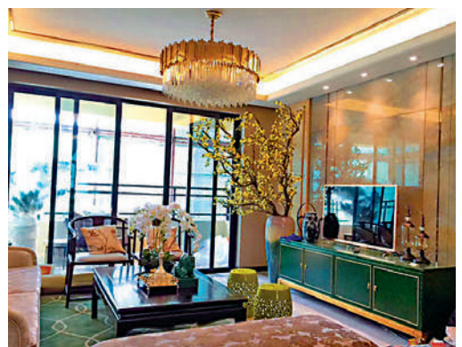
▲振業天頌花園樣板間。

振業天頌花園是由廣州本地開發商振業房地產斥巨資打造的項目，建築面積超過17萬平米，綠化率約為35%，容積率卻只有3.90，這意味着樓宇之間並不擁擠，住起來會比較舒服。