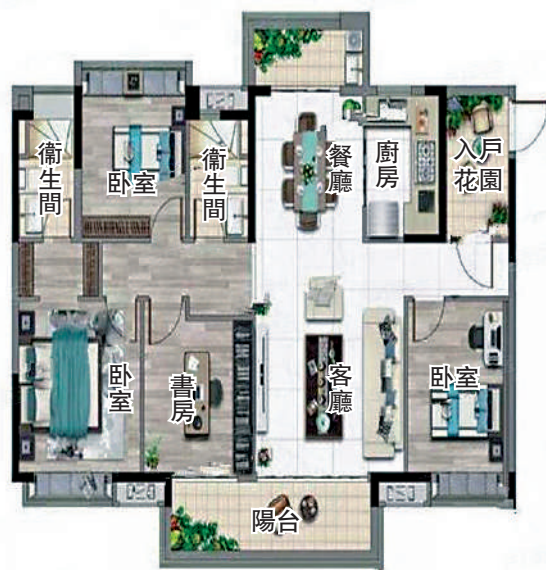
▲保利碧桂園公園大道140平米四室戶型圖。