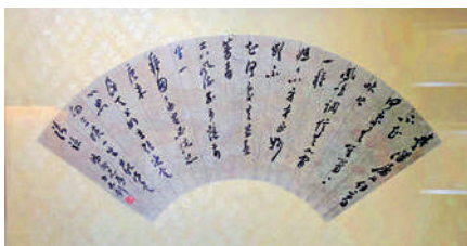
▲李大釗書法《七言詩》。