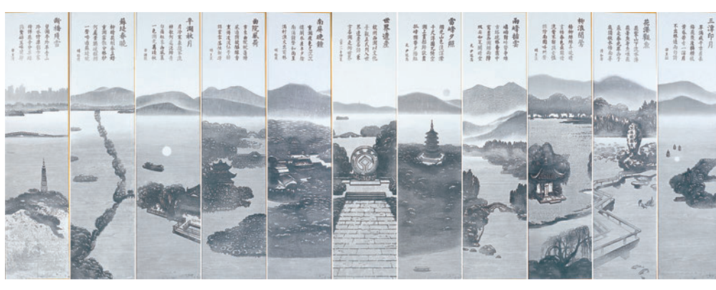
▲《東方文化名湖——西湖申遺成功》，版畫（合共11幅）。