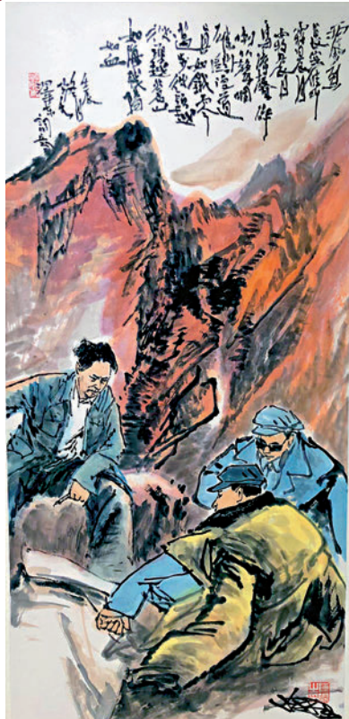
▲陳炯《毛澤東詞意圖》。