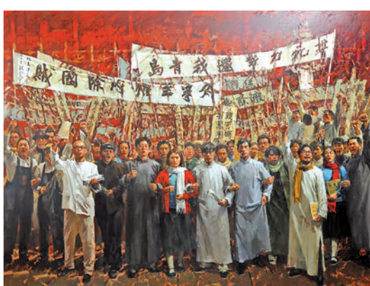
▲許江、孫景剛、鄒大勇繪《五四運動——紅潮》，油畫。