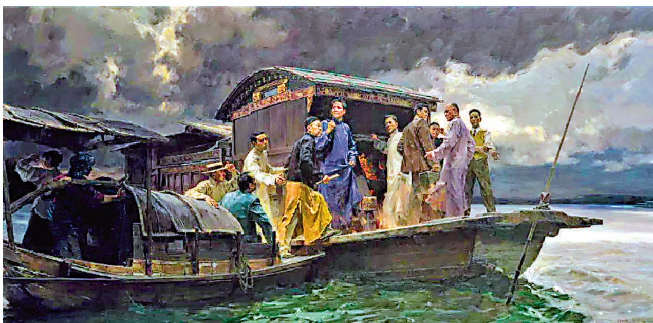
▲何紅舟、黃發祥繪《啟航》，油畫。

日期：即日起至7月6日 時間：7月4至5日 上午10時至下午7時 7月6日 上午10時至下午5時30分 地點：香港大會堂底座 費用：免費