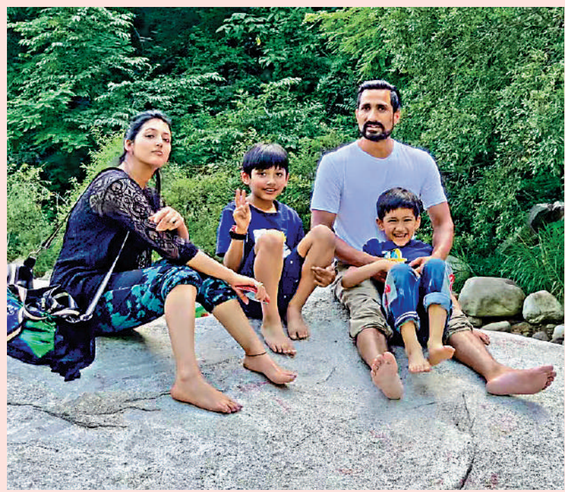
▶德福一家四口已經習慣了在中國的生活。

沒有就此停步，「在這樣一個欣欣向榮的國家，無論你是外國人，還是中國人，只要吃苦能幹，肯定會成功。」於是，德福辭掉餐廳的工作，開始創業之路。