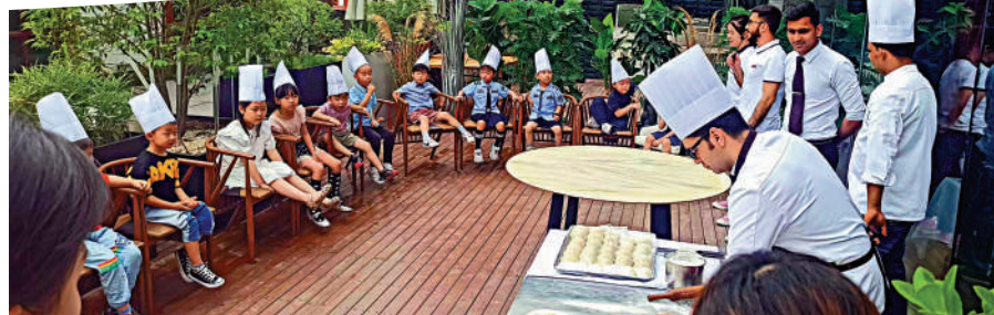
▲德福邀請西安小朋友到餐廳體驗印度美食文化。