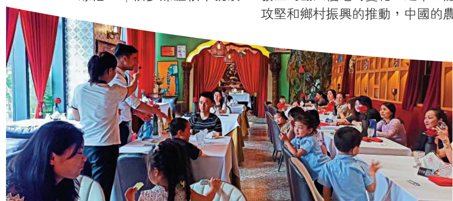
▲德福的印度餐廳充滿印度文化元素，廣受顧客青睞。受訪者供圖