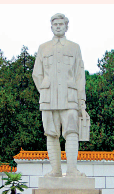
▲柯棣華醫生雕塑。