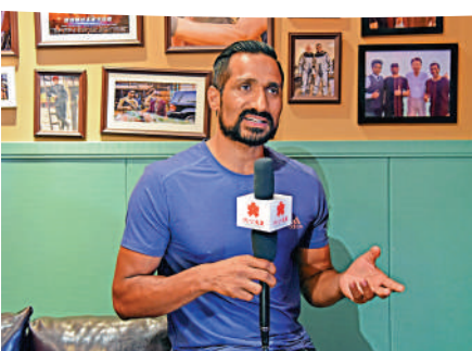
▲德福已經在中國工作生活了16個年頭。