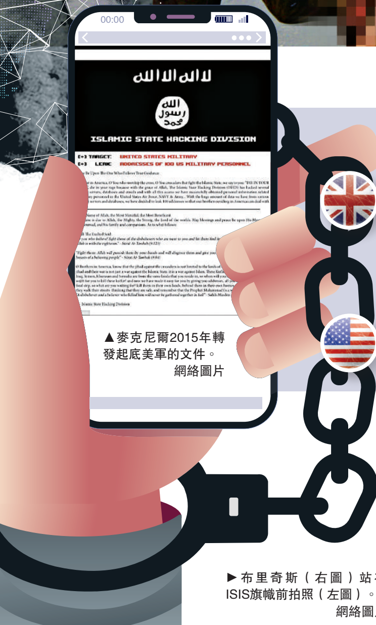
▲麥克尼爾2015年轉發起底美軍的文件。

時任波士頓市議會議長墨菲批評《滾石》的選擇令人作嘔，並直言：「《滾石》將察爾納耶夫包裝成一個英雄，一個被誤解的青少年，一個兩種不兼容文化的產物，但他不是。他是一個懦夫，一個殺人犯，其罪當誅。」