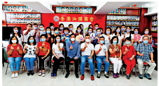
▲五個團體昨日聯合主辦簡介會,為長者及市民簡介消費券登記流程。