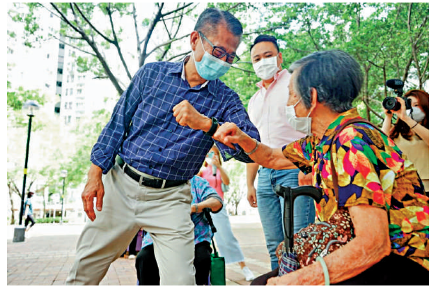
財政司司長陳茂波昨日落區到馬鞍山耀安邨,向市民介紹電子消費券。