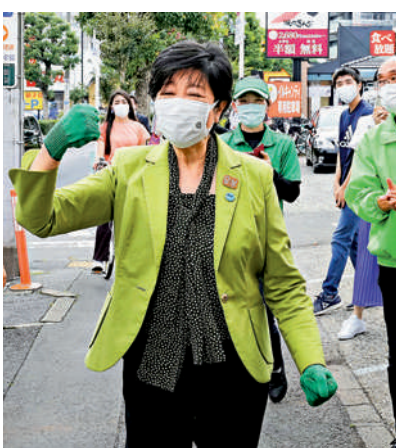
▲小池百合子4日為都民第一會拉票。

明、「小池百合子有意捨棄都民第一會重返國會」傳言等因素影響，自民黨原本預計可取得近50席的壓倒性勝利。但日媒分析指，疫情等失分項不足以抵銷小池過去5年的貢獻，且她日前過勞入院賺回一些同情分。自民黨在4月的參眾兩院3區議席補選中全敗，東京都議會選舉戰果也不如預期，令黨內人士擔憂眾院大選選情。