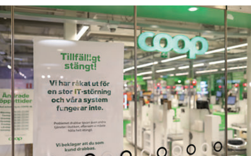
▲3日，瑞典連鎖超市Coop被迫關門。

美國聯邦調查局（FBI）稱，REvil也是上個月攻擊全球最大肉類供應商JBS的幕後黑手，那次攻擊以該公司支付價值1100萬美元的比特幣告終。此外，軟件商太陽風、美國最大燃油管道公司科洛尼爾等多家美國公司最近也遭到勒索軟件攻擊，暴露出美國互聯網基建的脆弱性。