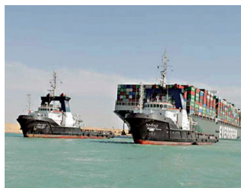
▲長賜號已被埃及扣留3個月之久。資料圖片

【大公報訊】綜合美聯社、德國之聲報道：當地時間4日，埃及蘇伊士運河管理局宣布與日本正榮汽船達成和解協議，將於7日放行已被扣留3個月的長賜號貨櫃船。長賜號3月底在蘇伊士運河航道上擱淺6天，嚴重影響全球航運。過去3個月，埃及當局與船東正榮汽船就賠償問題展開談判，但雙方並未公布包括賠償金額在內的和解協議細節。