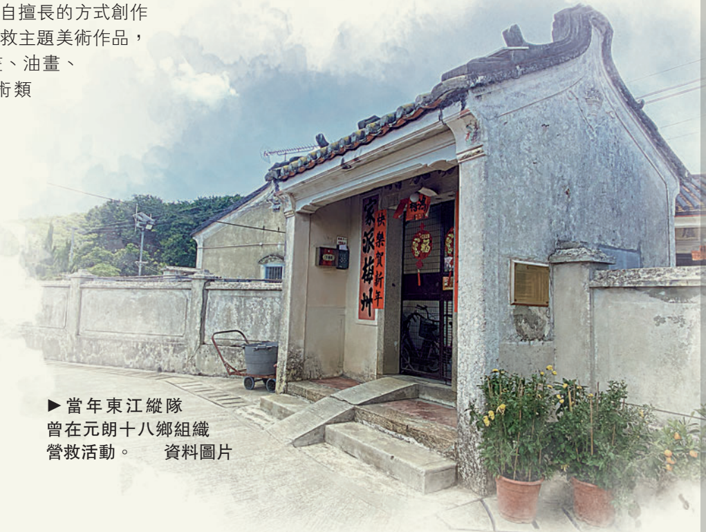
▶當年東江縱隊曾在元朗十八鄉組織營救活動。資料圖片