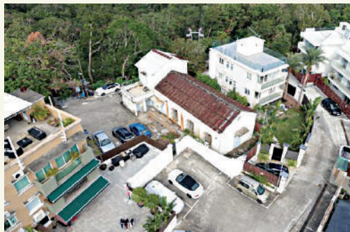
▲一九四二年東江縱隊港九獨立大隊在黃毛應玫瑰小堂宣布成立。