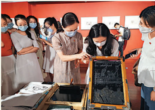
▲觀眾可現場體驗印刷過程。