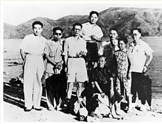
▲一九四一年，抗戰文化人在香港的留影。左起：陳歌辛、瞿白音、夏衍、丁聰、何香凝、洪道、廖夢醒、歐陽予倩。