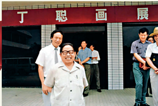
▲一九九四年深圳美術館曾舉辦「丁聰畫展」。圖為當年丁聰在深圳美術館廣場。

據展覽策展人李原原介紹，文化和旅遊部辦公廳公布的《二〇二一年全國美術館館藏精品展出季活動目錄》，全國共計三十個項目入選，「文化名人大營救」項目就是其中之一。鏡頭拉回到一九四一年底，彼時香港被日軍攻佔後，留困在香港的大批中國民主人士和文化人士遭到日本侵略軍的搜捕，生命安全受到嚴重威脅。在中國共產黨的領導下，東江游擊隊排除萬難，營救了何香凝、柳亞子、鄒韜奮、茅盾、夏衍、沈志遠、張友漁、胡繩、范長江、丁聰等在內的八百多名文化民主人士及其家屬，衝破日軍封鎖線，從香港成功撤離。