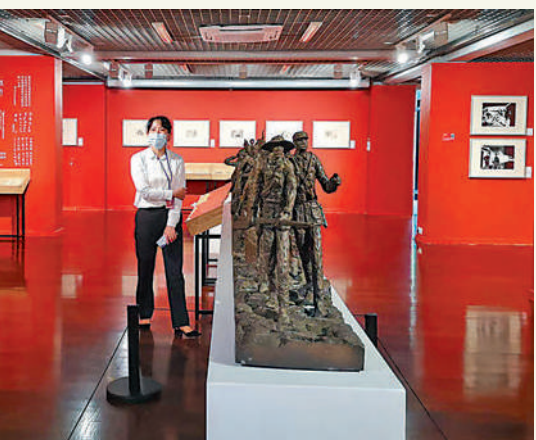
▲《大營救》青銅鑄造雕塑。