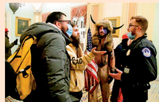
▲1月6日，闖入美國國會的暴徒與警員對峙。

作為美國企業，Fb及推特均在平台政策中明文禁止網絡起底，谷歌亦設有專門頁面，幫助遭起底者移除個人信息。2020年9月，美國知名歌手Kanye West在推特公布《福布斯》雜誌首席內容官的電話號碼，30分鐘後就因違反推特政策而被刪除。今年4月，美國科企甲骨文副執行長格盧克在推特公布一名與他發生爭執的記者的電郵地址等資料，推特很快凍結其賬號。