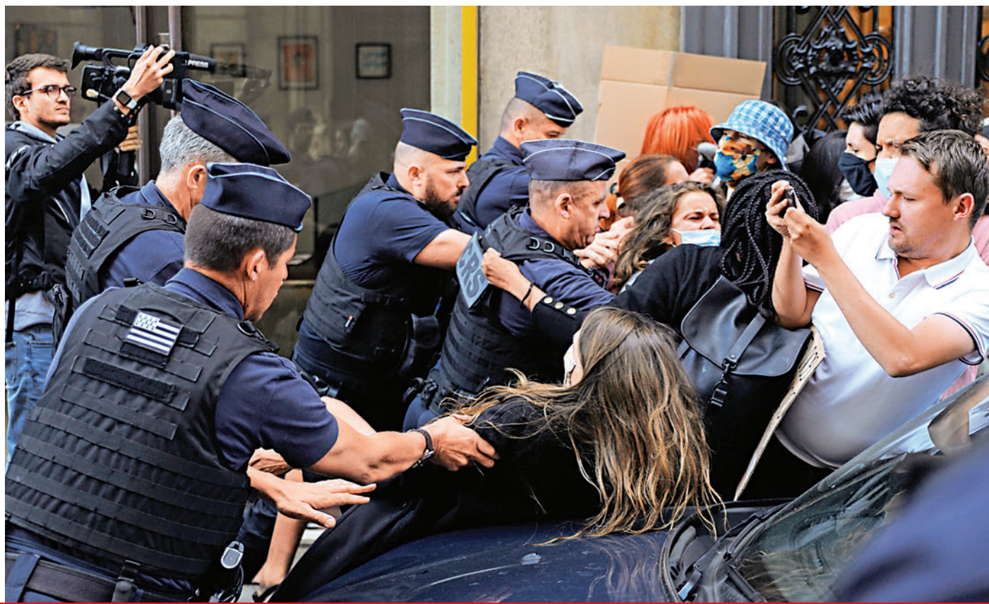
▲去年7月，法國示威者對着警員面部拍照。