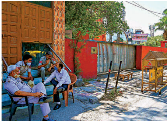
▲5月25日，印度警方守在推特辦公室附近。

美媒稱，推特失去豁免權後恐面臨大量官司。目前，印度警方已對推特及其高管提起至少5宗訴訟，內容涉及兒童色情、傳播仇恨等。5月，印度警方突襲推特位於德里和古爾岡的辦公室，調查推特將執政黨發言人的推文標記為「受操縱媒體內容」一事。