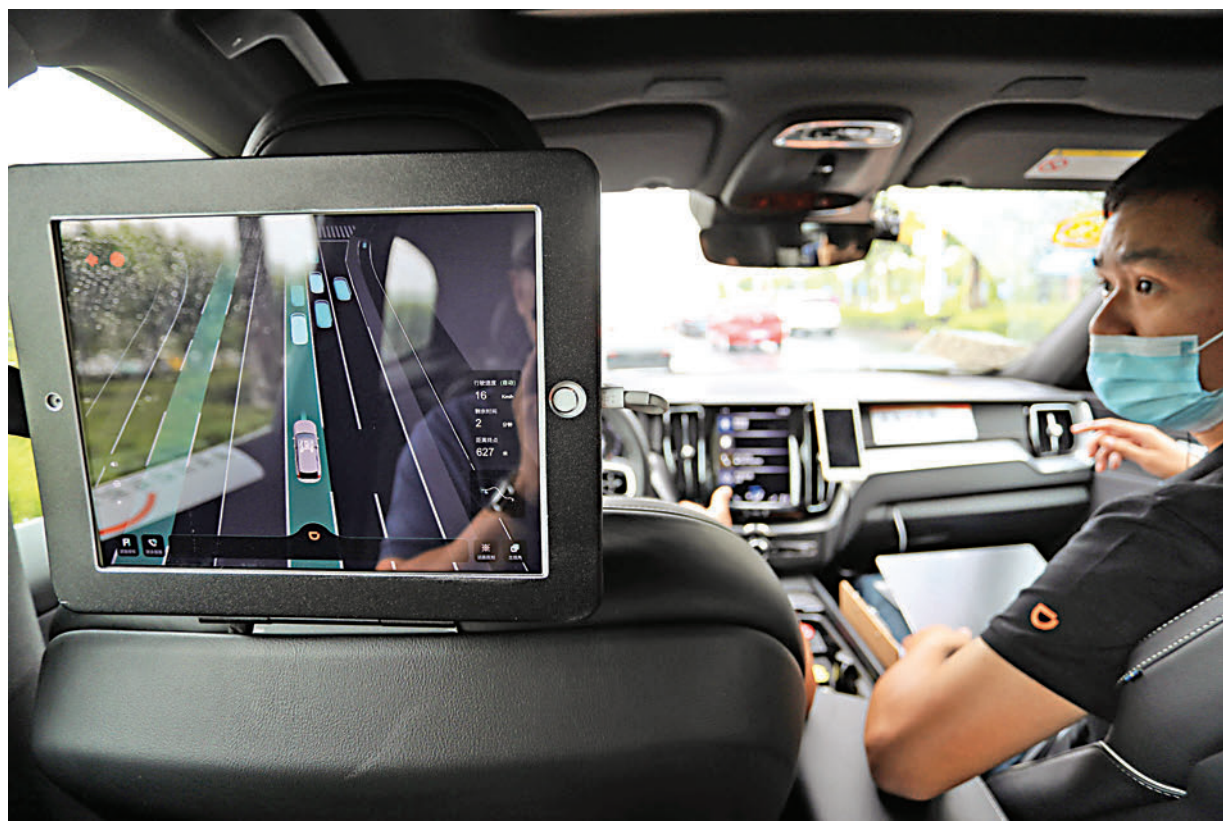
▲分析認為，數據確權是對個人數據和數據主權的最好保護。只有確立數據私有產權，才能更好地保護數據主權。