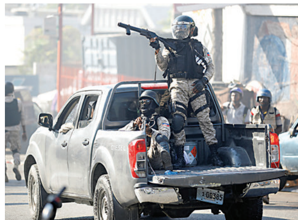
▲2月14日在太子港的反政府示威中，有警員持槍戒備。