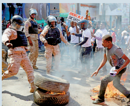
▲海地2月反政府示威中，警方和示威者對峙。