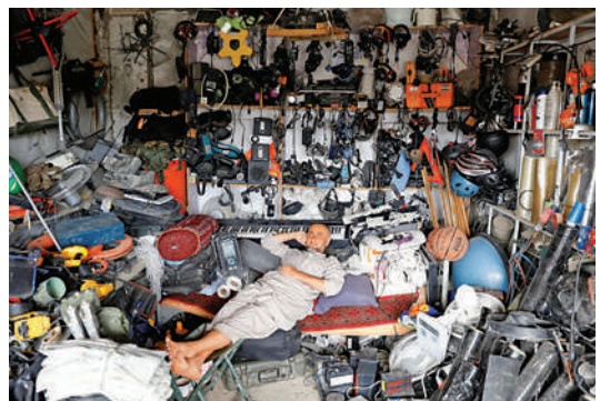
▲美軍撤離留下大量廢棄物，一名阿富汗男子5日出售尋得的籃球、揚聲器等二手商品。

「美國政府財產」字樣。據報道，出於「安全考慮」，土耳其、德國、俄羅斯已經關閉了位於阿富汗北部馬扎里沙里夫市的領事館。中國外交部7日再發安全警告，已提醒在阿中國公民盡早離境並提供必要協助。近期，自阿緊急回國人員中檢測發現有新冠病毒確診病例和無症狀感染者。