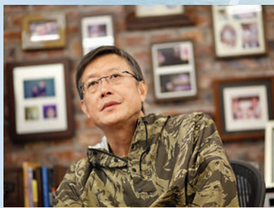
▲劉偉強繼《中國機長》後再執導以人物為主線的《中國醫生》。