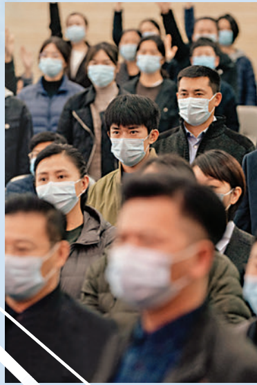
▲《中國醫生》以疫情下的武漢為背景。