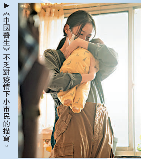
▲《中國醫生》不乏對疫情下小市民的描寫。