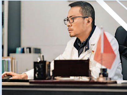
▲張涵予在新片中飾演醫生。