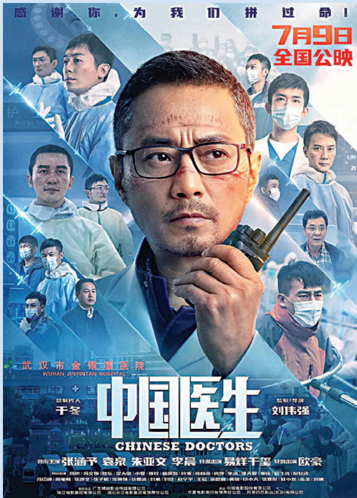
▲《中國醫生》電影海報。