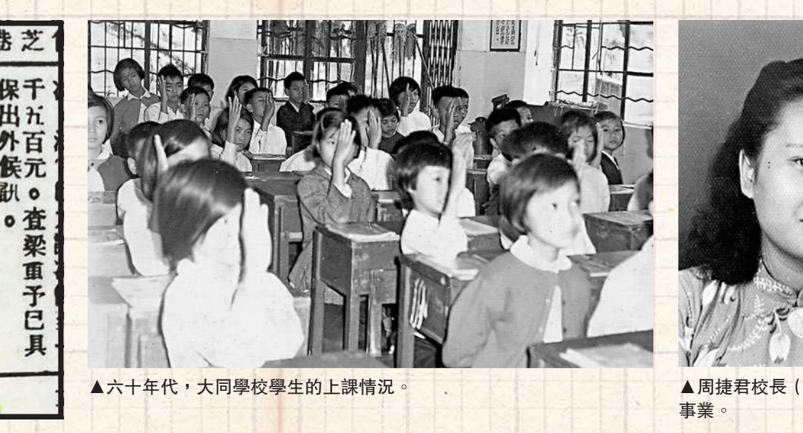
▲六十年代，大同學校學生的上課情況。

「大同」不只是失學小童的求學之地，也是區內居民的避難所、是愛國種子的培育地。「大同」的校長不僅是學校的領航人，還是學生最信得過的「婚姻把關人」。如此的良師益友，過身時，獲千人自發送殯，向他們作最後致敬。九十年代末，周家六兄弟姊妹再續父母大愛，將遺產悉數用於內地復建大同學校，支持國家農村教育，傳遞父母的大同理想，「年輕一代成長的土壤，需要愛國的氛圍。」