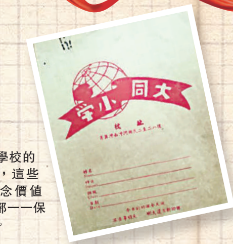
▶大同學校的功課簿，這些充滿紀念價值的物品都一一保存下來。