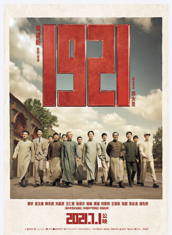
▲電影《1921》把時代之「大」融入到典型人物的人生選擇之中，通過生動的細節，表達了「理想」和「信仰」的力量，可以匯聚成推動時代進步的力量。

《1921》中的青年一代，都是具有崇高理想和使命擔當的一批風華正茂的時代青年。那個時代的青年以探尋救國救民之道路、拯救斯民於水火為己任；新時代的青年隨着改革開放的浪潮而不斷成長，在開闊眼界和放飛夢想的過程中與民族、國家融為一體，致力於實現中華民族偉大復興。百年前點燃火種，新時代共創榮光。歷史的發展告訴我們，任何青年一代都不會是所謂垮掉的一代，只要心存堅定的共產主義理想，他們必將與同時代同頻共振，與國家和人民偕行。