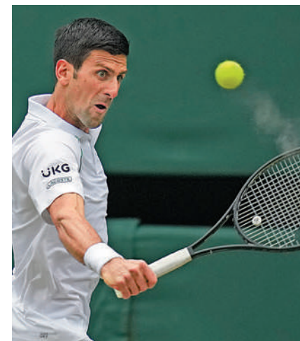
▲ 祖高域距離個人溫網第6冠、大滿貫第20冠還差一勝。

種子以6：3、6：0、6：7（3：7）和6：4力克波蘭的胡卡斯。波蘭人之前連續淘汰了2號種子、俄羅斯球手梅韋迪夫和「瑞士球王」費達拿，但未能招架貝倫天尼的強力發球和兇猛正手。