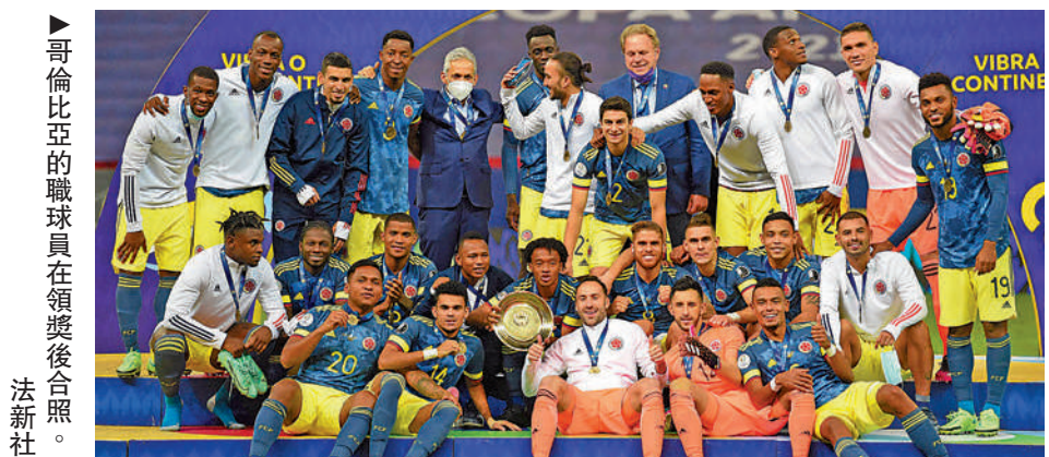
▲ 哥倫比亞的職球員在領獎後合照。