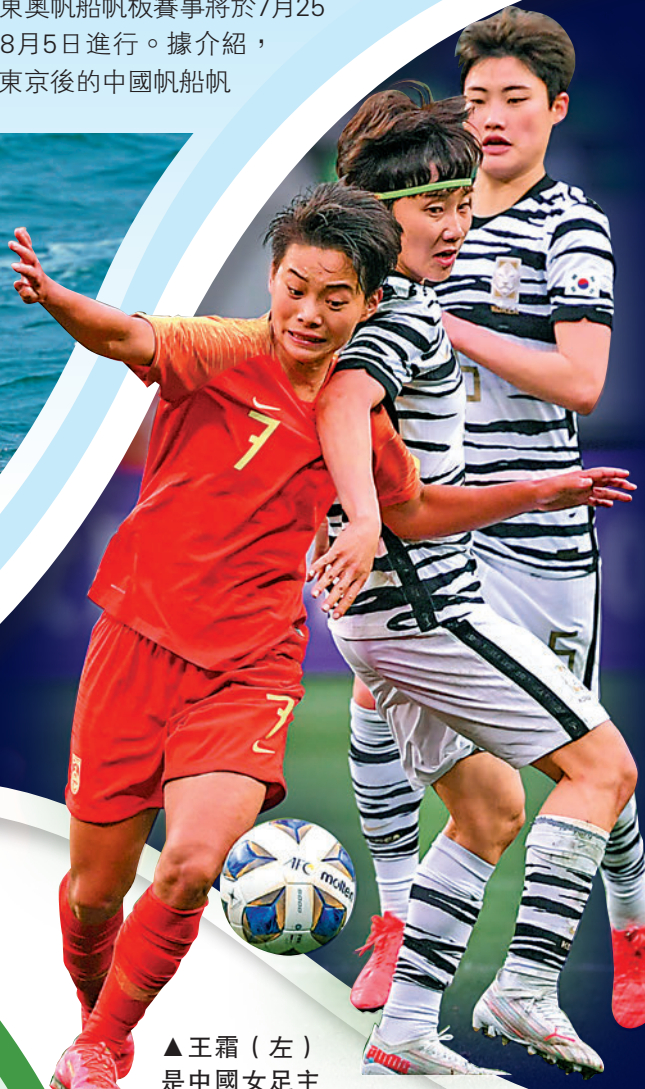
▲ 王霜（左）是中國女足主力。