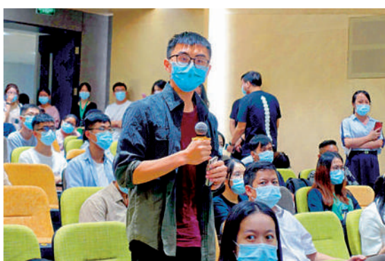
▲ 宣講會上，一名香港學生提問，廣東省人社廳等有關部門面對面答疑。

目前自己在廣州工作，平時可以粵語交流，和香港區別不大。而且實際上工作是「965」（朝九晚六、一周工作五天），沒有「996」那麼辛苦。這邊職場環境非常公開透明，無論要進入公司、還是晉升哪些崗位，都有面試、筆試等正規程序，安排都非常公開透明。