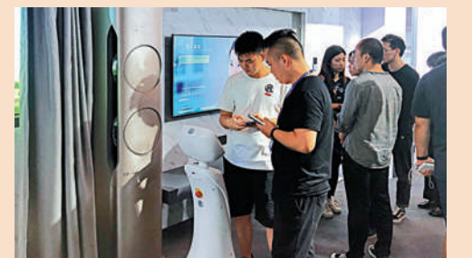
▲ 珠海創業青年參觀人工智能技術產品。

人以上就業的，最高貸款額度可提高至60萬元；對符合小微企業貸款條件的，最高貸款額度可達500萬元；並給予最長3年租金補貼、創業孵化補貼、創業就業稅收優惠「免申即享」等政策。