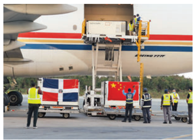
▲3月17日，運載中國援助的新冠滅活疫苗等物資的飛機抵達多明尼加首都聖多明各。資料圖片

品研究所與Gavi簽署的首個新冠滅活疫苗預購協議顯示，北京生物製品研究所將從2021年第三季度開始首次供應6000萬劑疫苗。Gavi還將視需求於2021年第四季度購買6000萬劑，2022年上半年再購買5000萬劑。