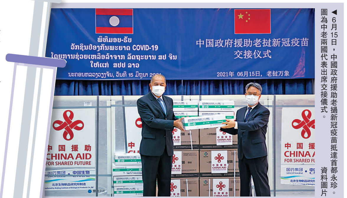
▲6月15日，中國政府援助老撾新冠滅活疫苗抵達首都永珍。圖為中老兩國代表出席交接儀式。資料圖片

過監管批准和/或世衛組織預認證的疫苗。20億劑疫苗將按照參與國人口比例平等地提供給所有參與國，優先提供給衛生保健工作者，然後擴大到老年人和有基礎性疾病弱勢群體。