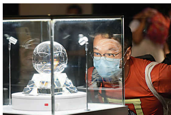
▲9日，「時代精神耀香江」最後一天展覽吸引大批香港市民、學生參觀，前來感受祖國科學發展。圖為市民近距離觀看月球土壤。