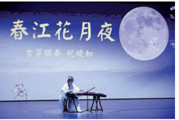
古箏獨奏《春江花月夜》由中國人壽保險（海外）呈獻。

中國銀行（香港）的舞蹈表演以火紅色演繹活力青春，動感十足；中國人壽保險（海外）古箏獨奏可謂古色古香，風韻優雅；招商局集團樂器表演《我的祖國》和中國光大集團女生合唱《中國心與香港情~我和我的祖國&東方之珠》彰顯香港與祖國的休戚相關、榮辱與共。