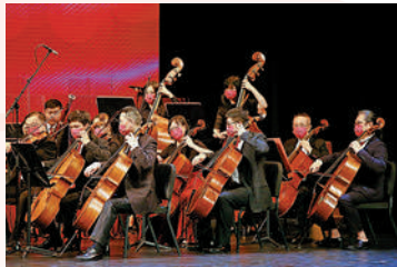
灣區愛樂香港樂團演奏《歌頌祖國》。