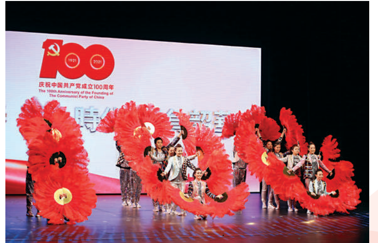
中國銀行（香港）有限公司帶來舞蹈表演《火紅的青春》。