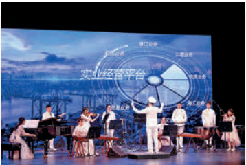
招商局集團樂器表演《我的祖國》。