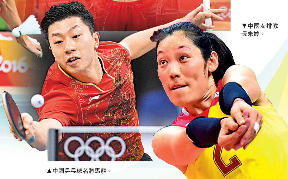
▲中國乒乓球名將馬龍。