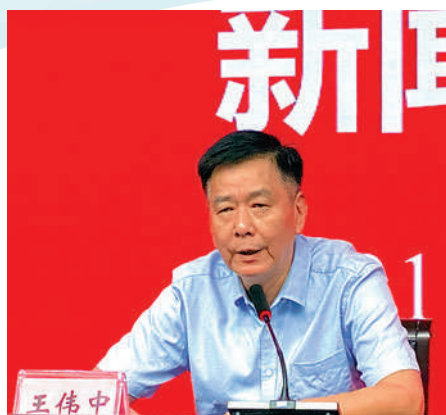
▲江蘇省體育局副局長王偉中出席發布會。

發布會上，「2020東京奧運會江蘇健兒獎勵基金」發布。據介紹，該基金由江蘇今世緣酒業股份有限公司向省發展體育基金會捐贈100萬元人民幣設立。