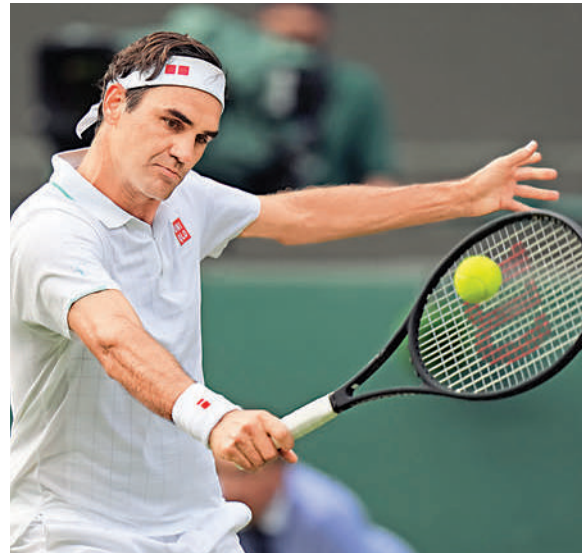
▲費達拿仍未奪過奧運單打金牌。

是2000年悉尼奧運，當時他於季軍戰落敗。2004年雅典奧運中，他接連於單打及雙打次圈出局。2008年北京奧運，他在單打8強出局，但與同胞華連卡夥拍在雙打奪金。極希望在單打登頂的費達拿，之後出戰2012年倫敦奧運，無奈輸給東道主球手梅利，屈居亞軍。上屆里約奧運，費達拿同樣因傷退賽。