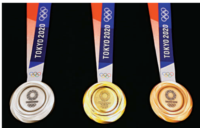
▲東京奧運的金（中）、銀（左）、銅牌。資料圖片

【大公報訊】東京奧運會即將開幕，為保障運動員健康及減少新冠肺炎的傳播，本屆賽事對運動員及工作人員都有不少管制措施。國際奧委會主席巴赫昨天在電話訪問中宣布，本屆奧運將打破以往由頒獎嘉賓把獎牌掛到得獎運動員身上的傳統，各項比賽的得獎選手必須自己把獎牌掛在自己身上，以降低人與人之間接觸的可能性。