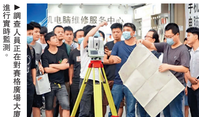
調查人員正在對賽格廣場大廈進行實時監測。

研判：桅杆和大廈主體結構具有2.12Hz共同振動頻率，形成共振必要條件，但上述局部累積損傷對結構動力特性產生影響，不影響主體結構安全