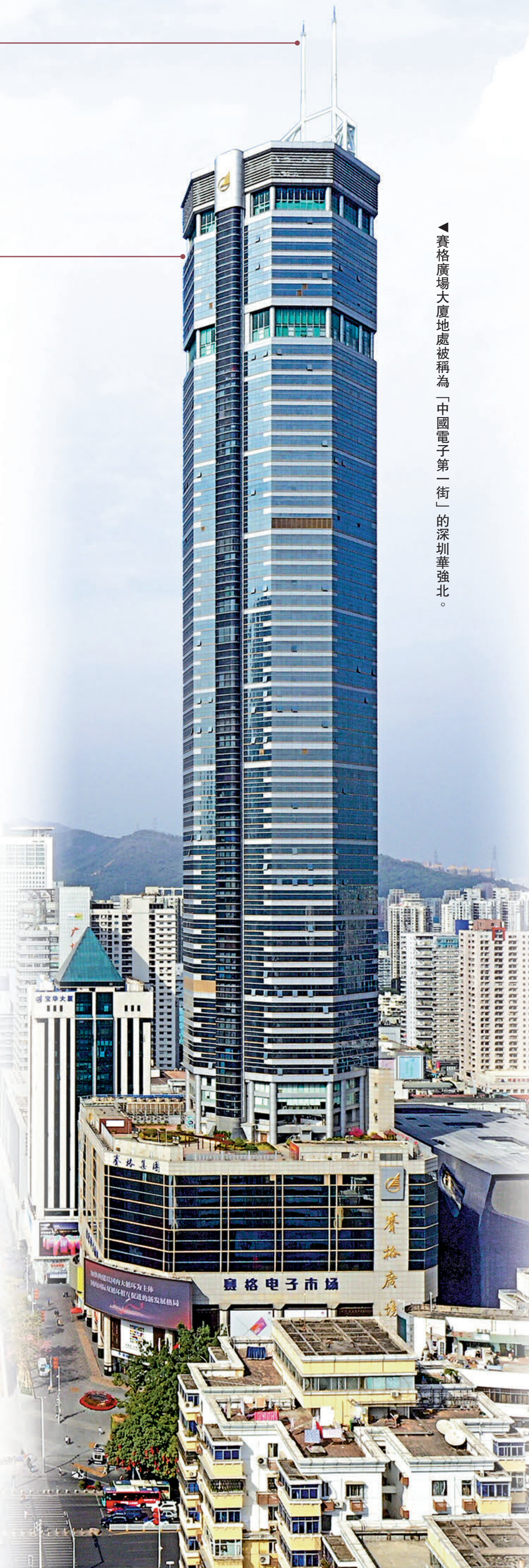
賽格廣場大廈地處被稱為「中國電子第一街」的深圳華強北。