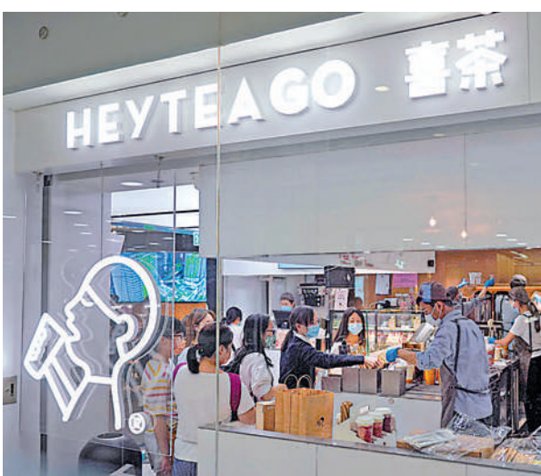
▲喜茶於2012年在深圳成立，截至2020年底，在內地有超過690家直營門店。圖為喜茶在香港的分店。