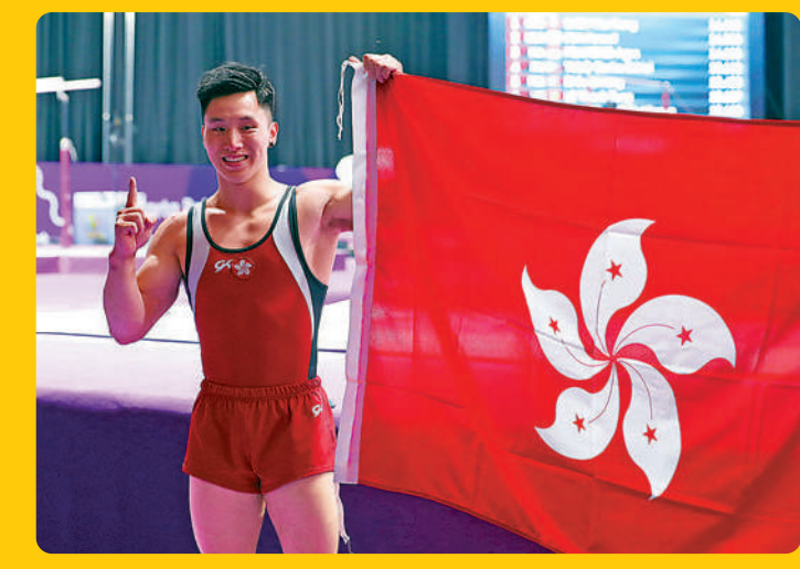
▲石偉雄是2014年仁川亞運及2018年雅加達亞運跳馬金牌得主。