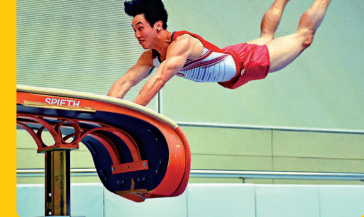
▲石偉雄是2014年仁川亞運及2018年雅加達亞運跳馬金牌得主。