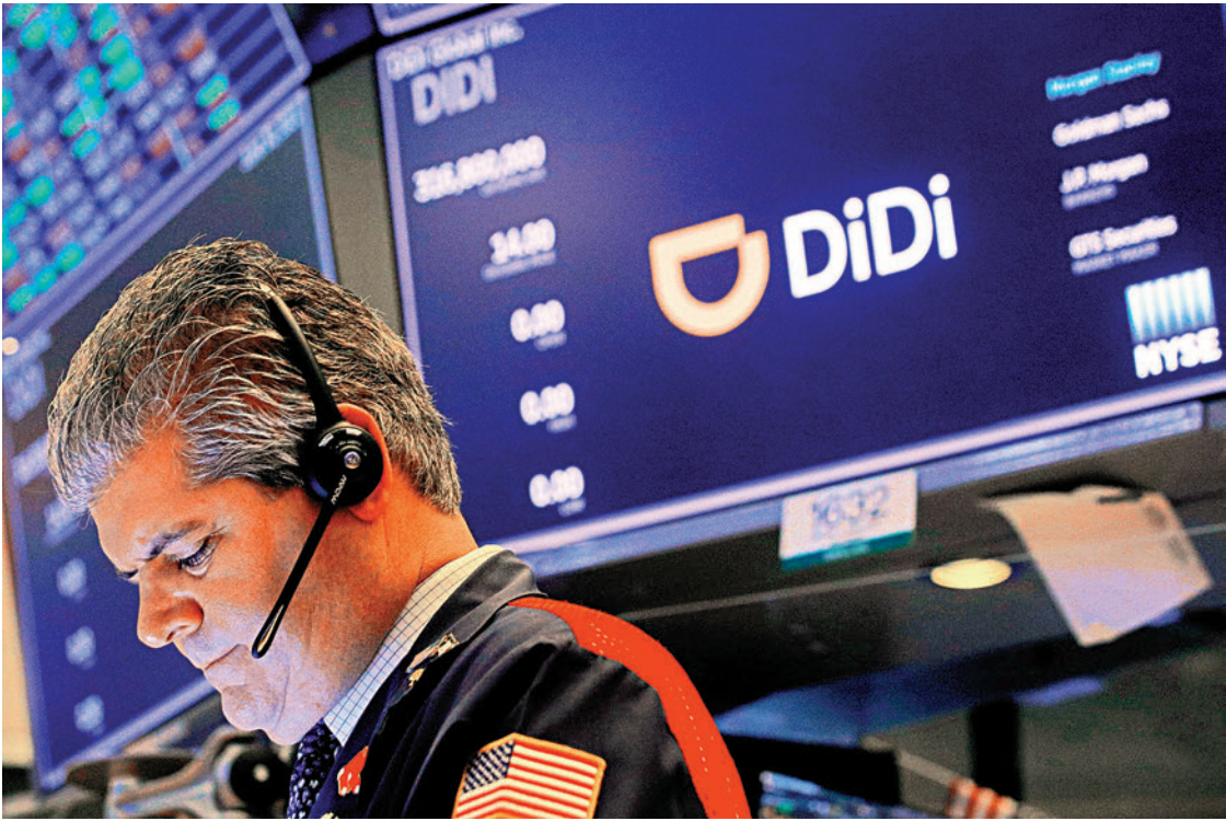
▲滴滴掌握交通領域資訊，被視為重要領域的關鍵資訊。