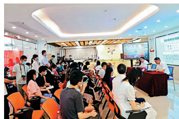
▲面對港澳學子的報考疑惑，廣東相關單位舉辦第二輪「港澳應屆生專場宣講會」。

到灣區出台不少針對香港居民的政策，很想過來感受一下是否真的這麼好。「我是19屆的學生，剛好符合這次報考要求。我很想走出香港，試試其他地方的發展潛能。」葉同學認為，「目前感覺大家都挺迷茫的，一方面不知道怎麼複習，一方面不知道怎麼選擇崗位，這次崗位有點多，專業需求也不像上次定向公務員考試那麼明確。」相關工作人員表示，如果港澳或者境外學生專業名稱和內地不同，可以根據就近的專業報考。在面試時提供成績單和相關證明資料給人事單位審核即可。