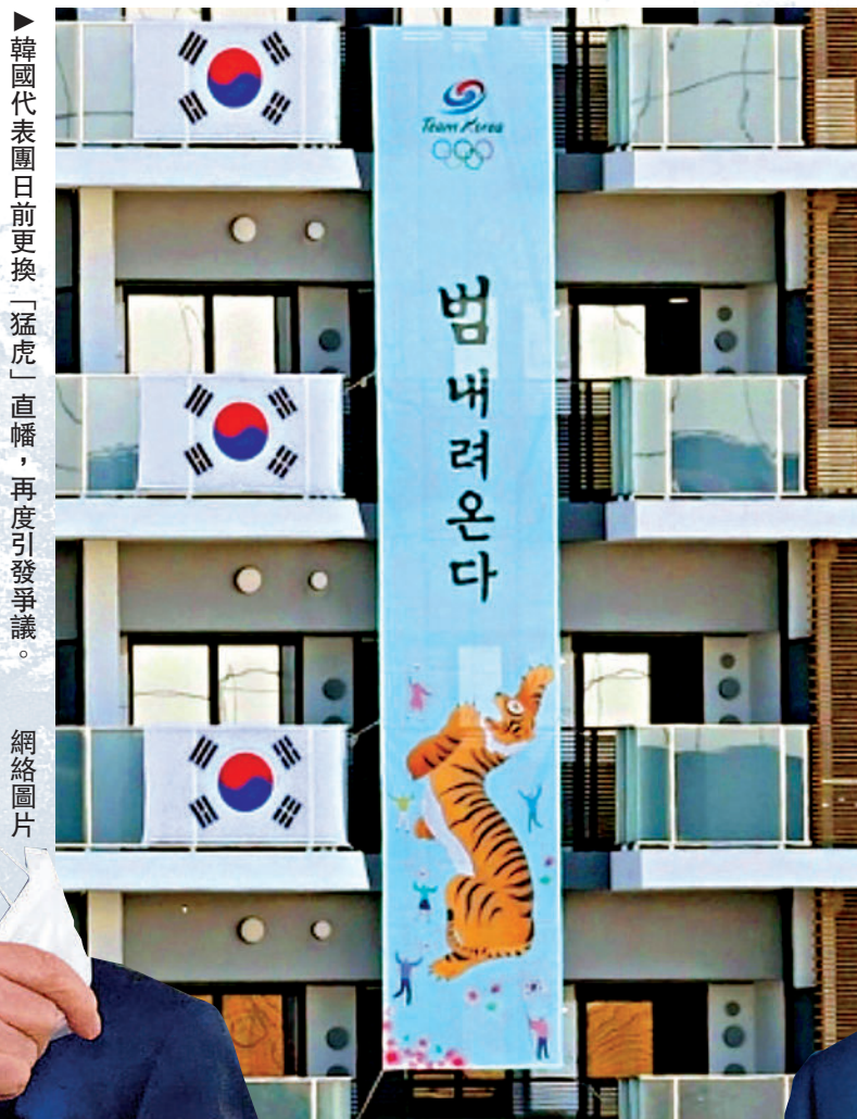
▶韓國代表團日前更換「猛虎」直幡，再度引發爭議。

日本網民認為「老虎」是在暗示豐臣秀吉曾命令手下加藤清正朝朝鮮獵殺老虎一事，在韓國民間，有很多人認為是日本的侵略導致朝鮮虎的滅絕。在老虎旁邊的相對位置，還出現了疑似日韓爭議島嶼「獨島」，有日本網民認為韓國是在表達「獨島主張」，涉嫌違反奧林匹克憲章。