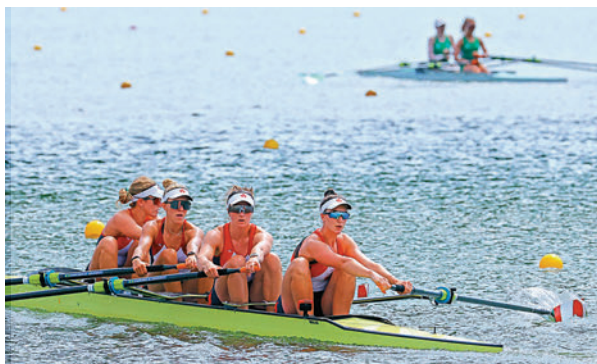
▲加拿大選手18日在海之森水上競技場訓練。