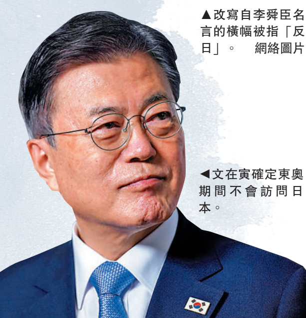
◀文在寅確定東奧期間不會訪問日本。