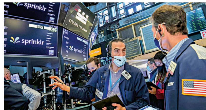
▲美國股市近期風雨飄搖，更有超級金融殺手先把資金撤離之家。