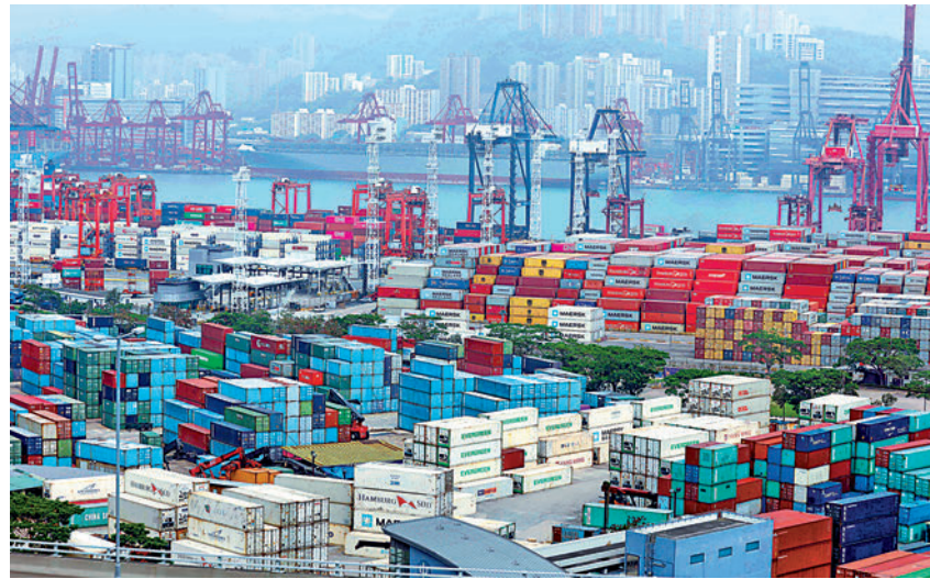
▲香港外貿出口持續強勁，連續兩個月出口同比增長24%。

值得注意的是，香港經濟穩步復甦，外商投資信心也進一步增強，尤其是歐美銀行集團持續加大投資香港，一方面是抓緊內地「十四五」規劃與粵港澳大灣區建設為香港經濟發展帶來新機遇；另一方面是配合世界經濟與金融重心東移，尤其是內地與香港進一步融合發展，兩地市場互通互融渠道不斷擴大，例如跨境理財通與南向債券通，香港金融業勢再創新高，國際金融中心地位穩如泰山。