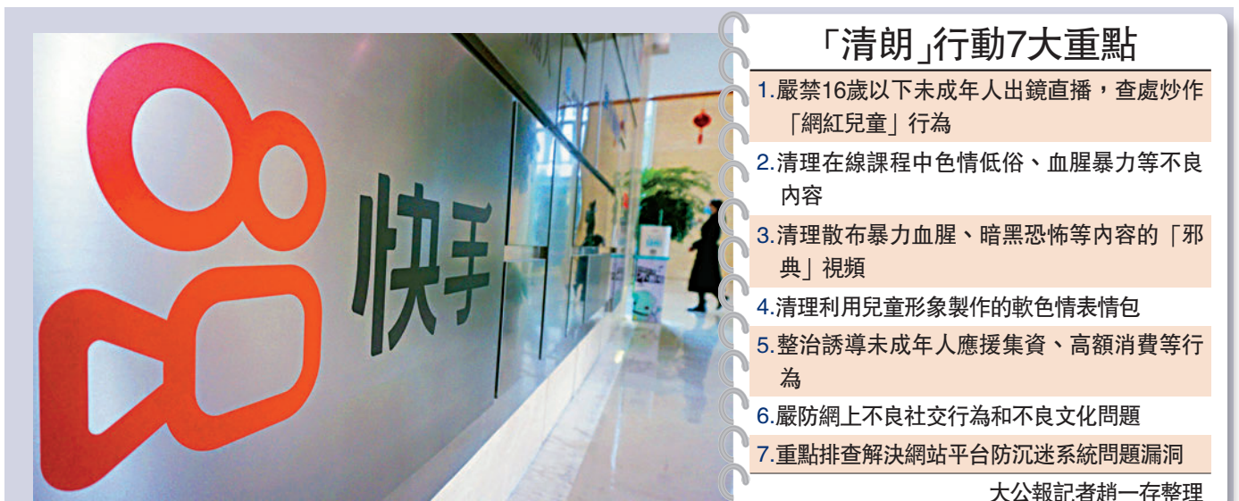
▲直播平台快手受近期事件影響，股價跌跌不休。

劉濤還指出，在當前國內外大形勢下，中國要實現兩個循環，特別是內地的循環向良性發展，就必須對網絡平台的品質和質量給予更為嚴格的監管，強調依法治理、依法監管和依法處置。