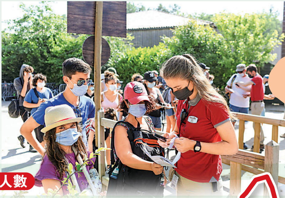
▲法國一主題公園員工21日檢查顧客的疫苗通行證。

【大公報訊】綜合法新社、《衛報》報導：受Delta變種新冠病毒影響，法國近期已進入第四波疫情，20日新增1.8萬宗確診病例。為增加疫苗接種率、控制疫情蔓延，法國實施新規，民眾21日起需要出示疫苗接種證明或新冠病毒檢測陰性結果，才能進入戲院、博物館等指定場所。根據疫苗註冊網站Doctolib數據，在總統馬克龍12日宣布啟用「疫苗通行證」(pass sanitaire)等措施後，多地出現「打針潮」，已有約430萬人預約打第一針。