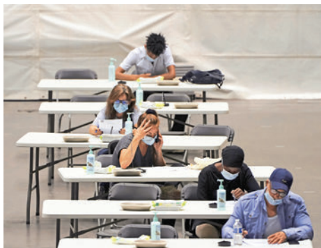
▲法國民眾7日填寫疫苗接種信息。 美聯社

一，去年11月的民調顯示，該國僅有25%的人口願意接種新冠疫苗。但截至7月19日，法國已有超過3700萬人已至少接種一劑疫苗，約佔總人口的56%。