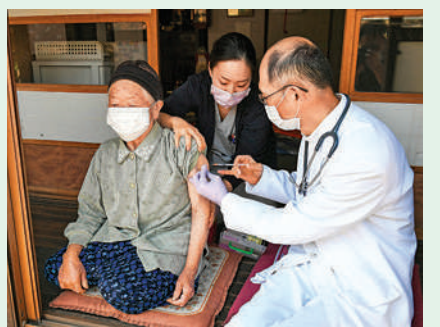
▲日本長者4月21日接種新冠疫苗。

選手因染疫而棄賽。東京奧組委總監武藤敏郎20日表示，不排除在病例激增的情況下取消奧運會的可能性。