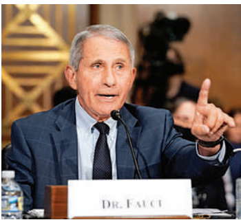
▲美國國家過敏症和傳染病研究所所長福奇。

實驗室，並指責他在5月11日的回應中撒謊。福奇聽後震怒道：「保羅參議員，我從來沒有在國會撒謊……你根本不知道自己在說什麼。」