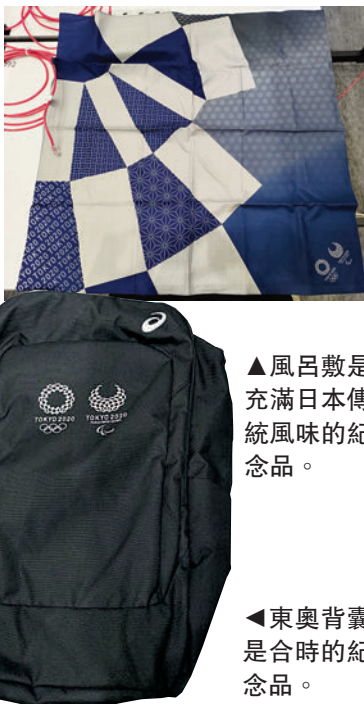
▲風呂敷是充滿日本傳統風味的紀念品。