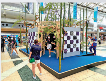
▲不少記者在奧運花卉布置前留影。