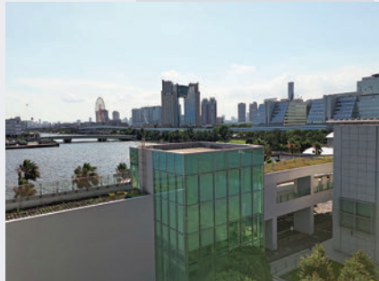
▲傳媒中心外景色怡人。