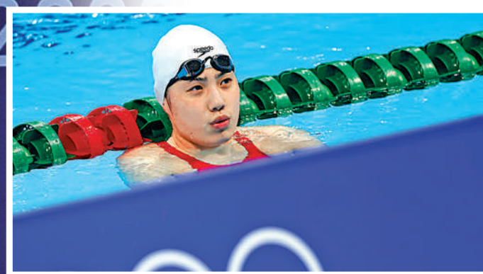
▲中國選手張雨霏在訓練中。