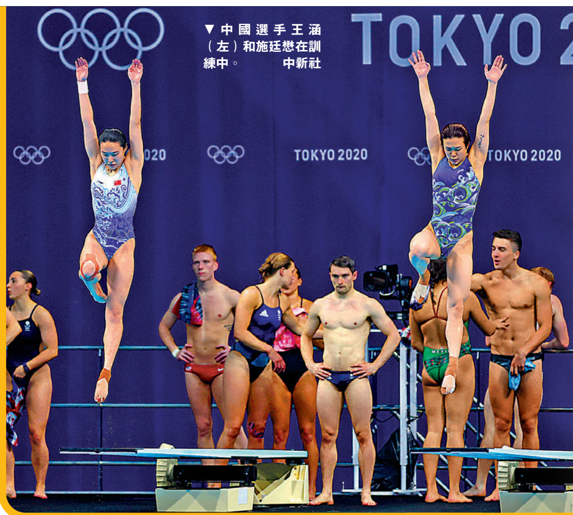
▼中國選手王涵（左）和施廷懋在訓練中。