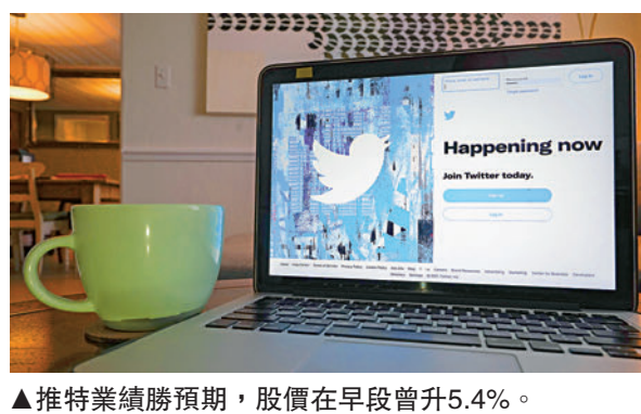
▲推特業績勝預期，股價在早段曾升5.4%。