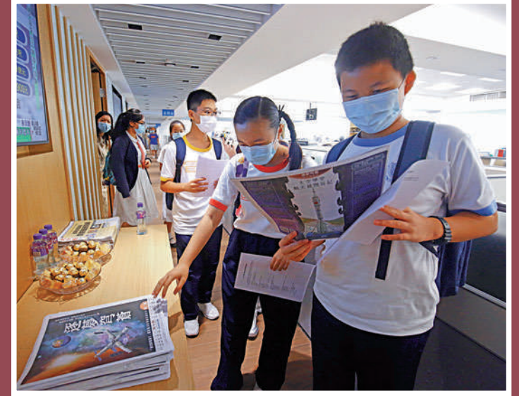
▲老師與學生在報史館開心合影。