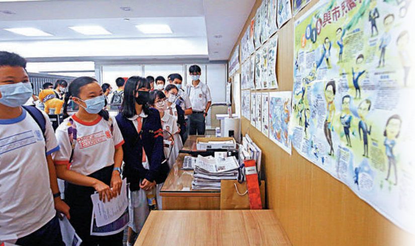
▲學生參觀《大公報》編輯部，對張貼的獲獎作品很有興趣。