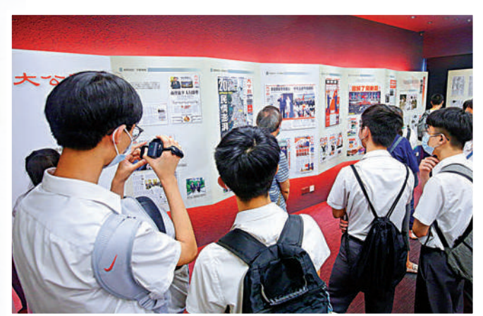
▲學生們認真閱讀《大公報》歷史。