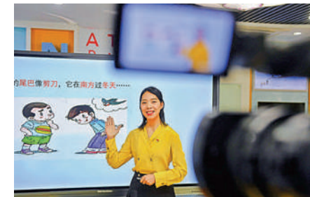
▲四川省成都市鹽道街小學正在開展線上教育教學。

《意見》提出要積極探索利用人工智能技術合理控制學生連續線上培訓時間。線上培訓機構不得提供和傳播「拍照搜題」等惰化學生思維能力、影響學生獨立思考、違背教育教學規律的不良學習方法。此外，意見還要求做強做優免費線上學習服務。意見提出，教育部門要徵集、開發豐富優質的線上教育教學資源，利用國家和各地教育教學資源平台以及優質學校網絡平台，免費向學生提供高質量專題教育資源和覆蓋各年級各學科的學習資源，推動教育資源均衡發展，促進教育公平。