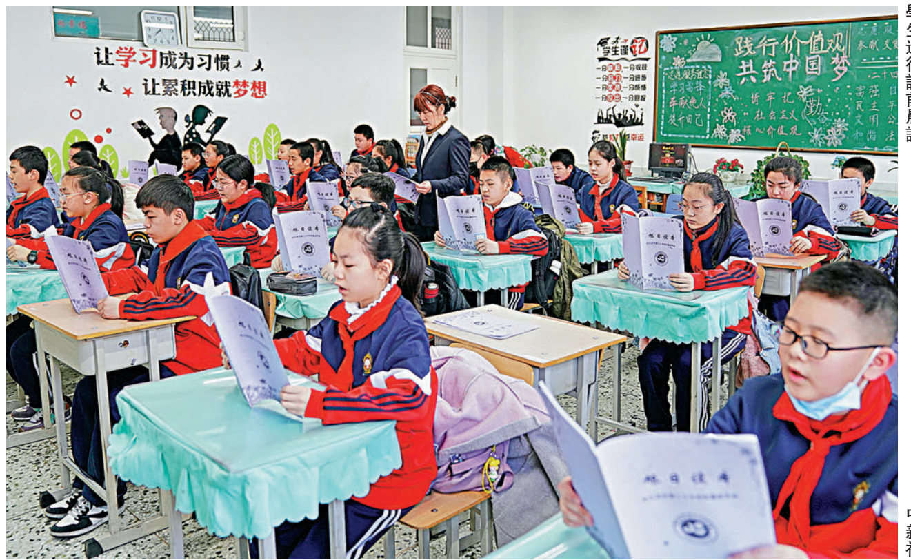
24日，中共中央辦公廳、國務院辦公廳印發《關於進一步減輕義務教育階段學生作業負擔和校外培訓負擔的意見》。圖為哈爾濱一所小學的學生進行課前晨讀。

對於內地學科類培訓機構一律不得上市融資的決定，光大新鴻基財富管理策略師溫傑指出，早前傳出相關消息，令教育股大跌，大致反映到政策之影響，暫不會再大瀉。