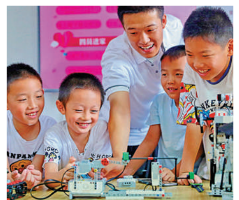
▲河北省秦皇島市的小朋友在社區舉辦的活動上與機器人互動。

《意見》還提出，學校和家長要引導學生放學回家後完成剩餘書面作業，進行必要的課業學習，從事力所能及的家務勞動，開展適宜的體育鍛煉，開展閱讀和文藝活動。引導學生合理使用電子產品，控制使用時長，保護視力健康，防止網絡沉迷。家長要積極與孩子溝通，關注孩子心理情緒，幫助其養成良好學習生活習慣。