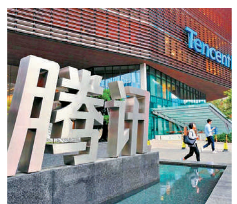
▲國家市監局依法對騰訊作出責令解除網絡音樂獨家版權等處罰。圖為騰訊總部大樓。

艾媒諮詢早前發布數據稱，2020年中國音樂版權市場規模預計達到281.7億元（人民幣，下同），但這一將近300億元規模的大蛋糕，80%被騰訊音樂吃下。騰訊音樂的收入亦遠超對手。艾媒諮詢CEO兼首席分析師張毅認為，反壟斷執法正把騰訊音樂趕出舒適圈，恢復在線音樂市場的有效競爭。對整個行業來講，也有利於激勵網絡音樂平台不斷創新，提供多樣化、個性化服務。