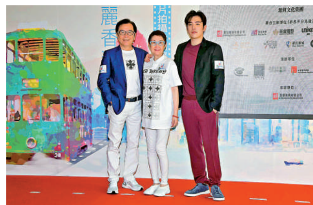
▲姜大衛一家三口出席啓動禮。

周秀娜希望透過計劃帶動更多生力軍入行。「隨着疫情緩和，本地電影的拍攝逐漸增多。鼓勵更多年輕人接觸電影並踴躍參與其中，把握這次難得的機會。」她希望參賽者盡可能發揮創意，不要為自己的創作設限。