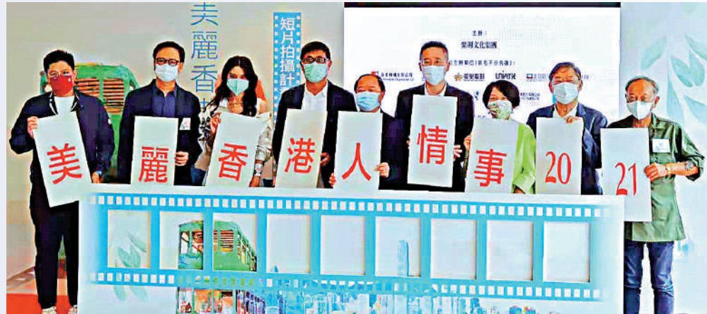
▲出席嘉賓啓動「美麗香港人·情·事2021」短片拍攝計劃。

「美麗香港人·情·事2021」短片拍攝計劃，由逾十間本地著名電影公司聯合主辦，今年是第二屆舉行。除現金資助外，整個拍攝及製作過程中，參賽者亦可獲業內人士的專業指導；獲資助製作的短片中，出色的製作團隊可獲協助未來在影壇上作進一步發展。