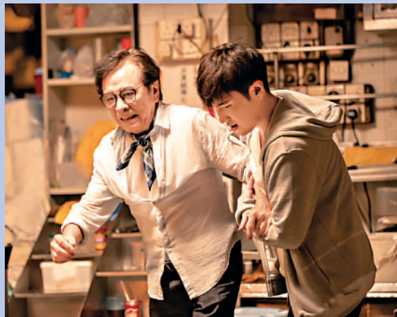
▲《離不開的牛雜麵》劇照。