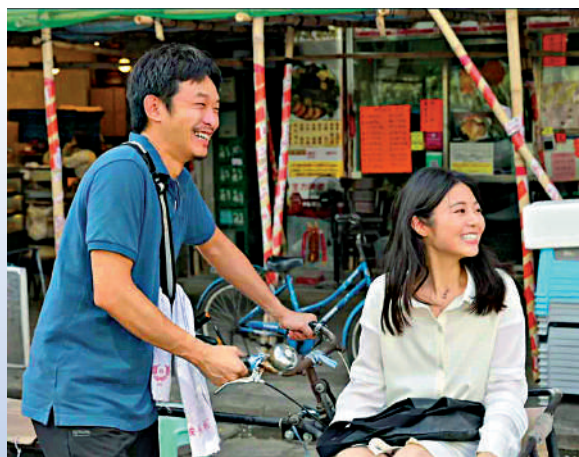
▲《石磊磊兮葛蔓蔓》劇照。