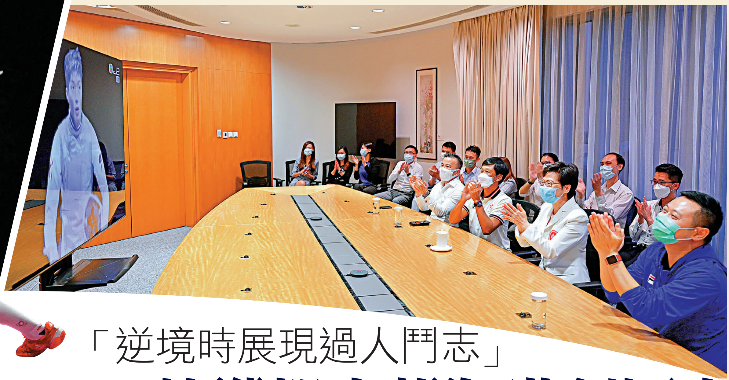
▲林鄭月娥（前排右二）與多名官員觀看張家朗比賽的電視直播。