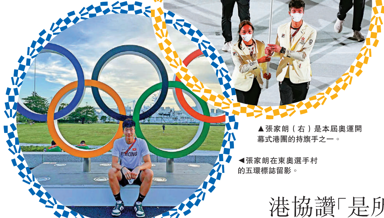
▲張家朗（右）是本屆奧運開幕式港團的持旗手之一。