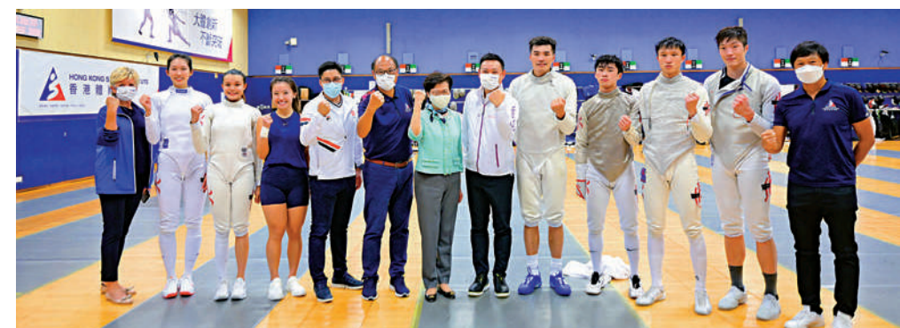
▲林鄭月娥（左七）在劍擊隊出征東奧前，為他們打氣。