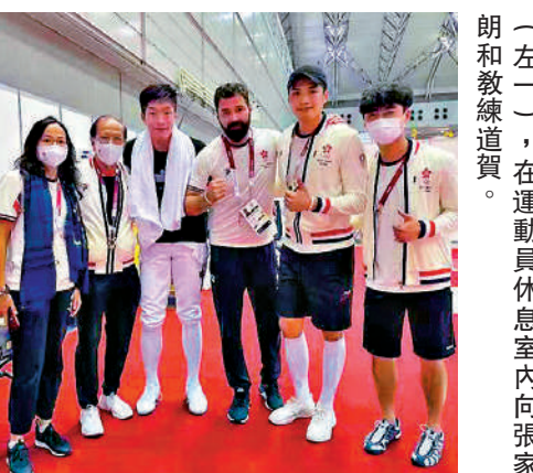
▲張家朗（左三）、香港劍擊隊隊員與香港副團長（左二）、唐文潔（左一）在運動員休息室內向張家朗祝賀。

港協表示，張家朗在比賽中充分展現追求卓越、奮力拼搏的體育精神，令香港市民深受鼓舞，引以為傲，亦是所有人的典範。這次勝利亦是一個團隊的努力，港協感謝張家朗教練團隊的支持。 港協祝願港隊成員在其他賽事中繼續盡情發揮，為香港締造更佳成績，並期望特區政府會繼續調撥更多資源給予香港運動員，從而提升他們的成績及香港在國際體壇上的地位。