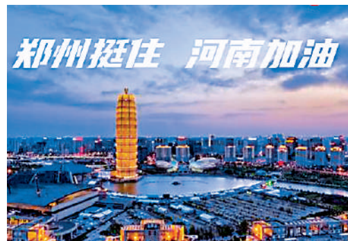
▲河南鄭州等地遭遇罕見暴雨災害，牽動人心。 資料圖片

在我關注鄭州的災情時，我的情感更複雜些，因為鄭州是我的家鄉，此刻我雖身不在鄭州，心裏卻始終惦念着。街上淌着水前行的人們可都有平安到家；在斷水斷電的情況下，家鄉的父老鄉親們能否有碗熱湯麵吃；在抗洪第一線的官兵們是否有危險，大家雖都親切地叫他們「叔叔」，但其實他們好些才剛滿二十歲；還有剛好要生產的孕婦如何是好，大人孩子是否都平安……我還想起孩童時在鄭州經歷的一次暴雨，肯定沒有