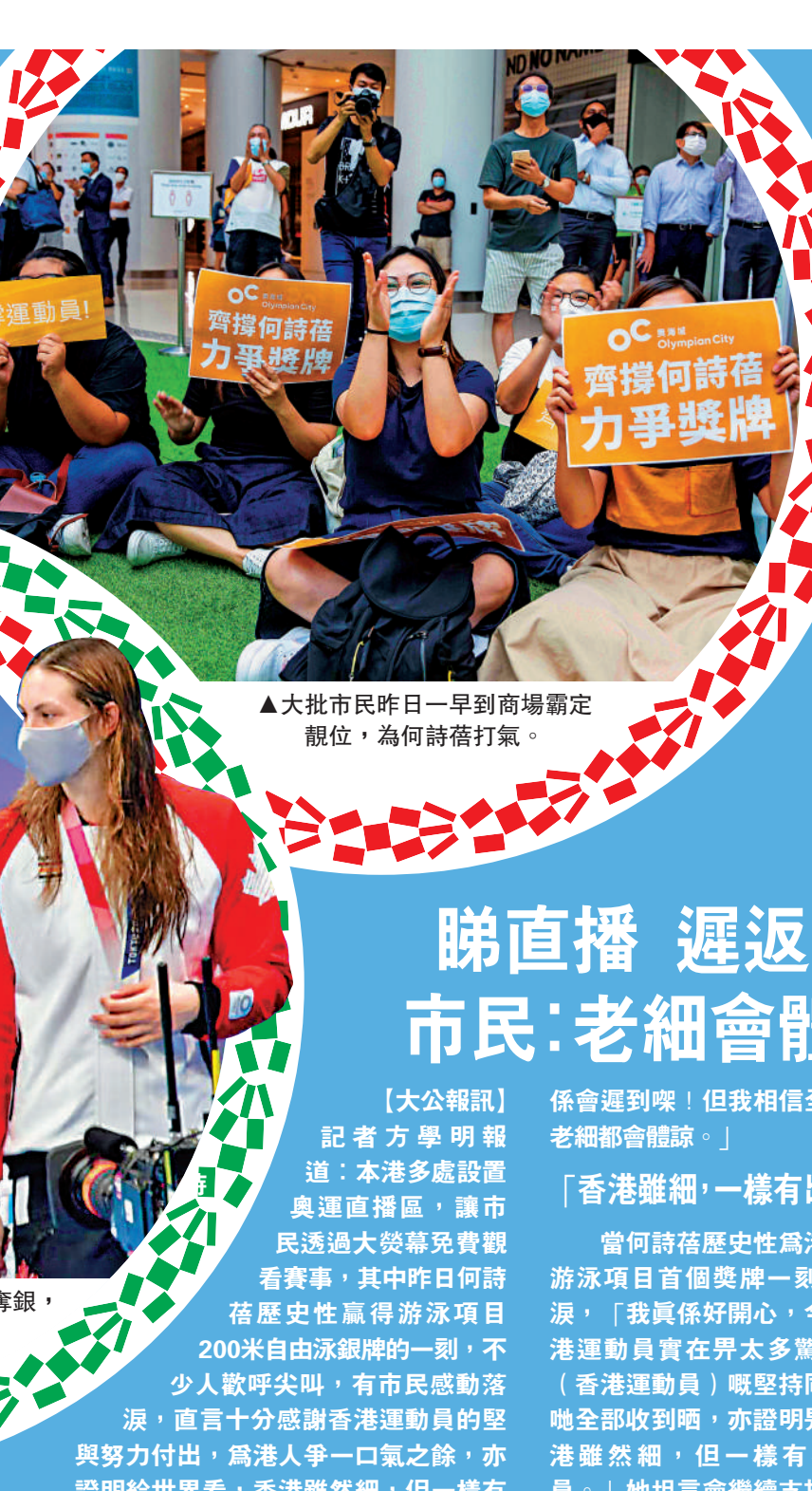
▲市民爭睇直播，見證何詩蓓領獎一刻，拍手歡呼。