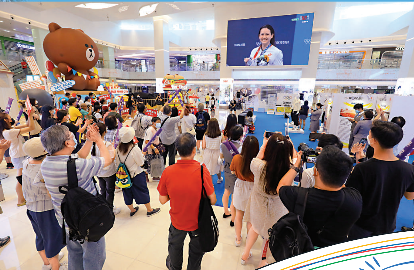
▲市民爭睇直播，見證何詩蓓領獎一刻，拍手歡呼。