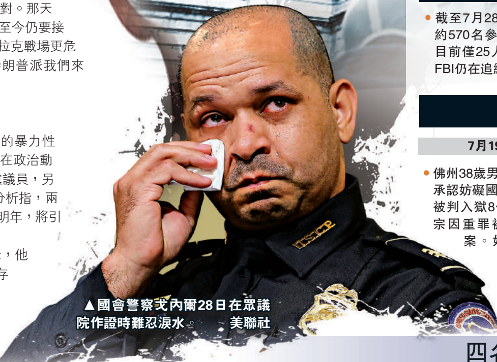
▲國會警察法諾內28日在眾議院作證時難忍淚水。