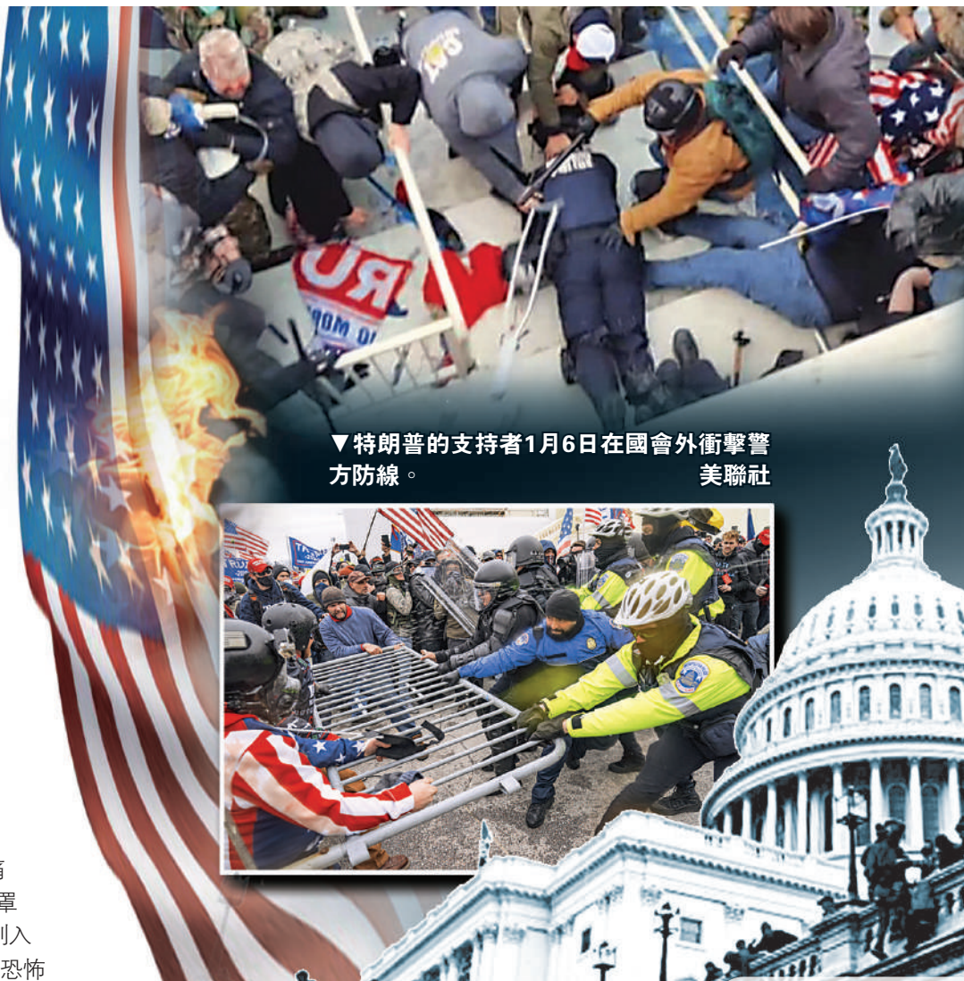
▼特朗普的支持者1月6日在國會外衝擊警方防線。

1月6日後，聯邦調查局（FBI）和司法部隨即聯手發起大「圍剿」，抓捕和起訴工作迅速推進。迄今，美國司法部已起訴約570名涉參與國會騷亂的人士，其中25人認罪，3人被判刑。據司法部公布的數據，至少165人被控襲警，包括50多名使用致命或危險武器對警員造成嚴重身體傷害的人。