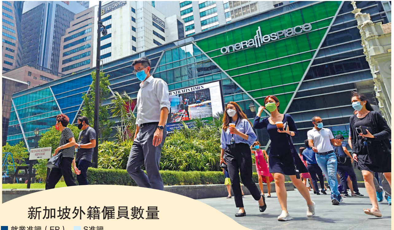
新加坡去年起提高外國人申請工作簽證的門檻，主要針對金融服務高薪行業。