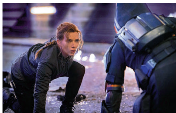
▲史嘉麗祖安遜在《黑寡婦》中的劇照。