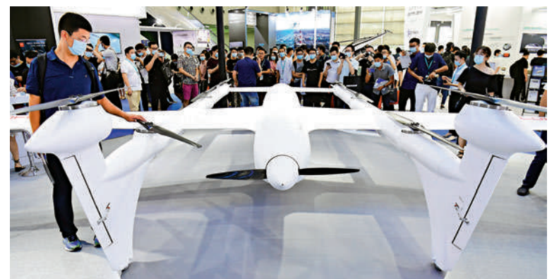
▲去年9月，大型垂直起降智能飛行器——V400信天翁在深圳國際無人機展上全球首發。