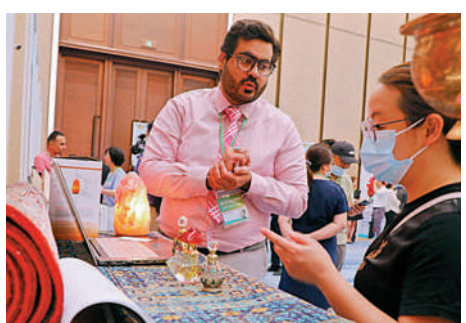
▲第四屆進博會上招商路演暨消費品展區展前供需對接會在滬舉行，一名參展企業工作人員（左）向參會嘉賓介紹產品。

劉愛華說，下一步，要持續深化供給側結構性改革，深入貫徹新發展理念，着力釋放內需潛力，大力助企紓困，扎實推進高質量發展，努力完成全年經濟社會發展的目標任務。