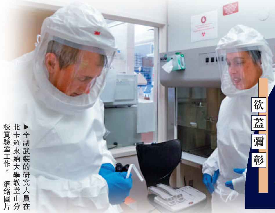
▲全副武裝的研究人員在北卡羅來納大學教堂山分校實驗室工作。