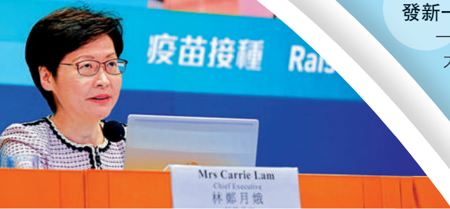
▲林鄭月娥表示，為防止輸入病毒在社區擴散，須透過外防輸入及提升疫苗接種率兩部分建立抗疫雙屏障。

本港連續56天無出現本地新冠病毒感染個案，行政長官林鄭月娥昨日率領四位局長舉行記者會，宣布最新防疫抗疫安排。林鄭月娥表示，本港已達至本地「清零」目標，但全球疫情反彈，截至上月底，本港已錄得108宗Delta變種病毒個案，惟本港接種率僅約48%，遠遠不足以防止輸入病毒在社區擴散，因此須透過外防輸入及提升疫苗接種率，建立抗疫雙屏障。