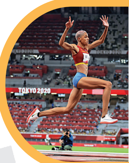
委內瑞拉田徑女將羅哈斯以15米67刷新女子三級跳遠世界紀錄。