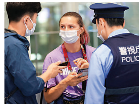
白俄羅斯田徑女將齊瑪諾斯卡亞1日被迫回國。路透社

在東奧官員陪同下，齊瑪諾斯卡亞1日在羽田機場酒店度過一晚。波蘭官員2日表示，她目前在波蘭駐東京的大使館內，並已取得相關的人道主義簽證，計劃未來幾日內前往波蘭。（路透社）