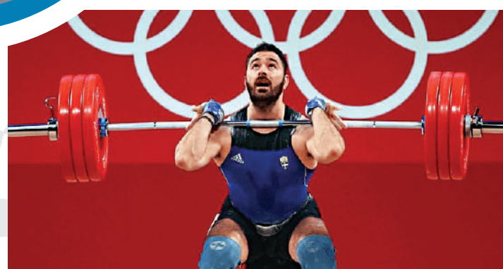
希臘舉重運動員亞科維迪斯7月31日參加男子96公斤級舉重比賽。