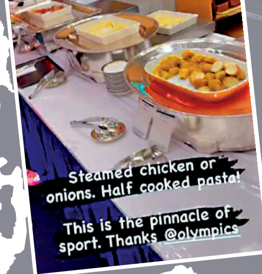
Steamed chicken or onions. Half cooked pasta! This is the pinnacle of sport. Thanks @olympics