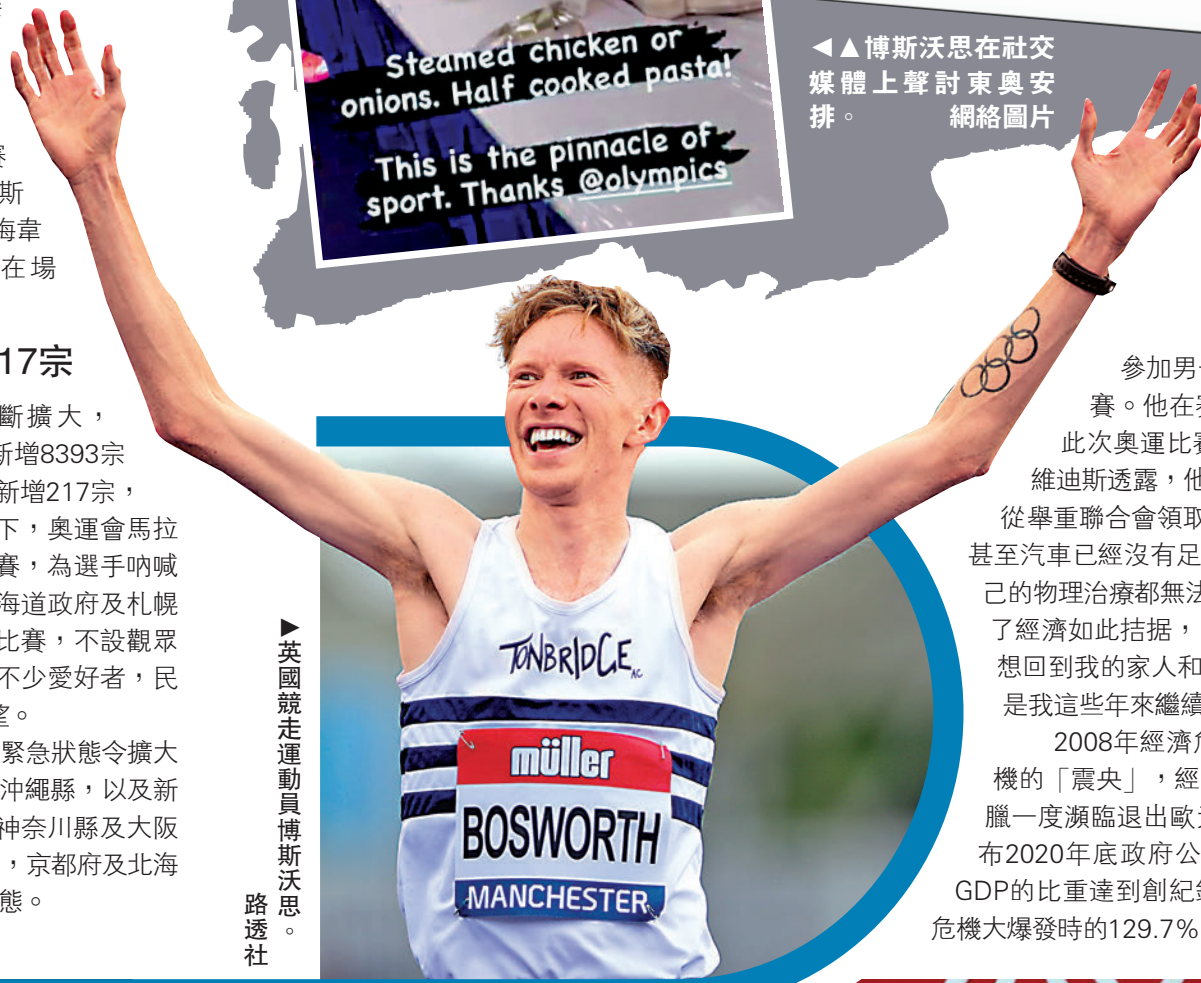
英國競走運動員博斯沃思。