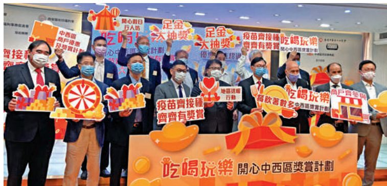
「吃喝玩樂 開心中西區」活動籌備委員會宣布推出消費獎賞計劃，將送出超過二千萬的禮品及優惠。

「吃喝玩樂」活動除商戶優惠外，亦有玩樂體驗。中西區海濱長廊邊設有玩樂設施，包括受兒童歡迎的波波池，主題會隨時節變化。堅尼地城一側的堅農圃亦提供一系列農耕體驗活動，市民可報班體驗從發芽到收割的農耕樂趣。