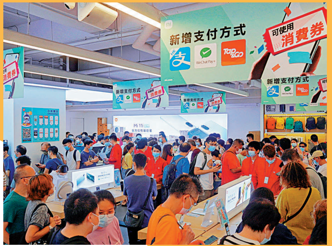
消費券的派發在全城掀起爆買潮，各家商戶推出不同優惠吸客。