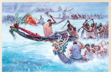
▶符聞一作品《同心協力》。