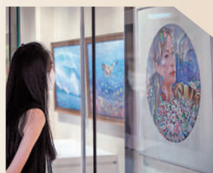
◀◀觀眾欣賞《浪花淘盡英雄》。