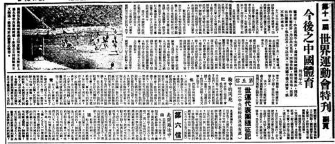
▲一九三六年八月十四日大公報刊登岡部平太文章《今後之中國體育》。

日本在柏林奧運會斬獲6金4銀8銅，在獎牌榜位居第八，與中國形成鮮明對比。8月14日，大公報刊登了前南滿鐵路體育部部長岡部平太的文章《今後之中國體育》，題目與12日大公報社評幾乎完全一致。原因是岡部看到12日大公報社評後，有感而發，投書報社。大公報原文照發，希望借他山之石以攻攻玉之效，激勵國人進取。刊登外國人的奧運評論，這也是中國報業史上首開先河。