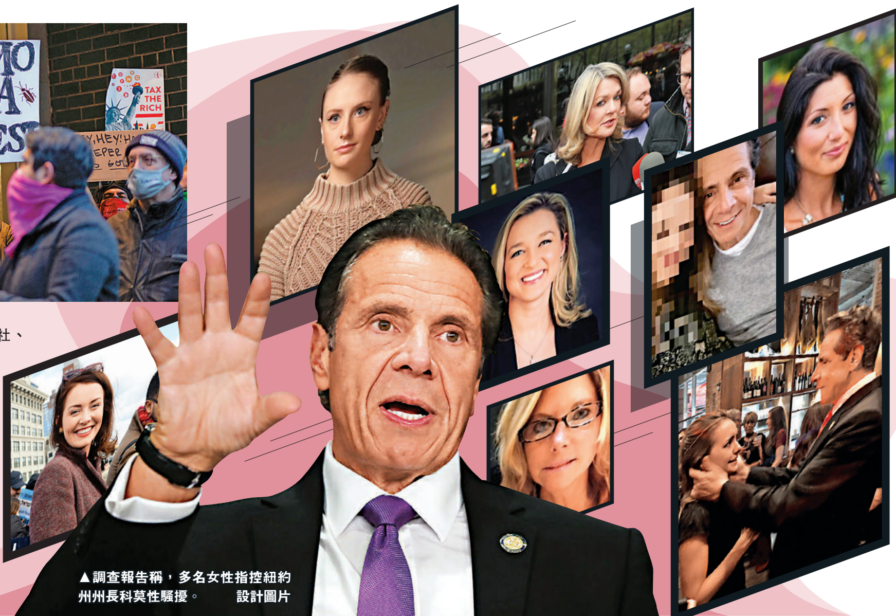
▲調查報告稱，多名女性指控紐約州州長科莫性騷擾。設計圖片

【大公報訊】綜合美聯社、中新社、《紐約時報》報道：經過近5個月的調查，紐約州總檢察長詹樂震3日宣布，對州長科莫性騷擾的獨立調查已經結束，證實他對多達11名女性有性騷擾行為，違反了多項聯邦法律和州法律。雖然科莫發布視頻否認指控，但民主黨上下迅速表態，總統拜登當天更呼籲科莫辭職。據報道，如果科莫不主動辭職，紐約州議會將啟動彈劾程序。這位曾經因積極抗疫、怒斥前總統特朗普而一時風光無兩的民主黨政治明星，此次似乎仕途難保。