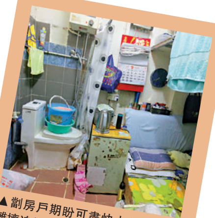
▲劏房戶期盼可盡快上公屋，脫離擠迫的生活環境。

房委會最新數字顯示，有逾15萬宗一般公屋申請，以及逾10萬宗配額及計分制下的非長者一人申請。一般申請者的平均輪候時間為5.8年，創22年新高。當中長者一人申請者的平均輪候時間為3.6年，兩者數字皆持續惡化。