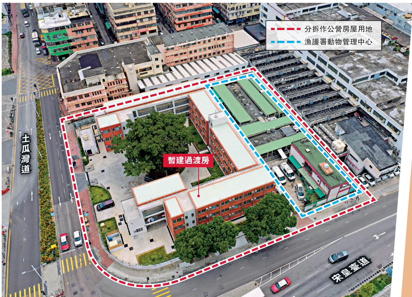
▲土瓜灣一幅已改劃作興建公屋的用地，因為漁護署動物管理中心遲遲未遷出而推遲計劃五年，部分用地暫時興建過渡房，被批評本末倒置。