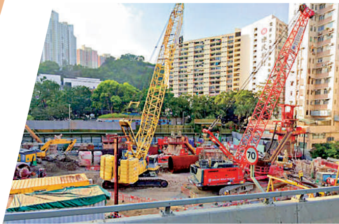
▲高山道的官地正按部就班進行工程，興建一座33層高的居屋，提供約450個單位，料最快於2024年首季落成。