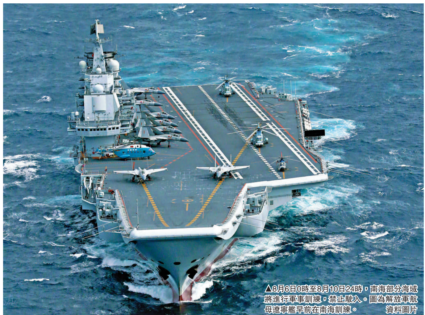
▲8月6日0時至8月10日24時，南海部分海域將進行軍事訓練，禁止駛入。圖為解放軍航母遼寧艦早前在南海訓練。資料圖片

5日，內地社交網絡出現多段「威龍」殲-20在市區低空機動飛行的影片，拍攝地點據稱為江蘇省啟東市。中國航空工業集團有限公司官方微博其後回應：「威龍震天，希望沒有太吵到午休的鄰居們。」